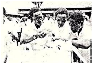
真剣に靴を選んでいきます