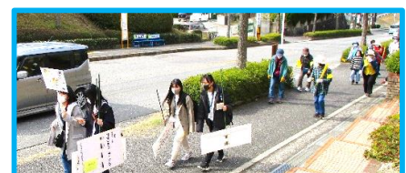
地域の人と「ウォークラリー」 2021年3月