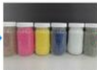
加工され、再生ポリプロピレン 素材へと変身されます