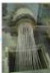
リサイクル工場 粉々に粉砕されます