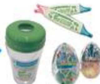
様々なリサイクル品に 生まれ変わります