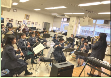
練習に励む吹奏楽部

音楽に興味がある人は、ぜひ入部してください。また、3月25日(土)16時から、佐伯区民文化センターで定期演奏会を行います。一年の集大成として皆さんを楽しませますので、ぜひ見に来て下さい!